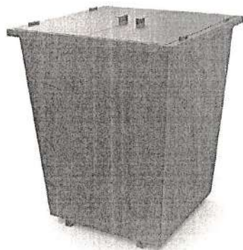
Рис.1 Контейнер для сбора ТКО

В контейнерах запрещается складировать горящие, раскаленные или горячие отходы, крупногабаритные отходы, снег и лед, осветительные приборы и электрические лампы, содержащие ртуть, батареи и аккумуляторы, медицинские отходы, а также иные отходы, которые могут причинить вред жизни и здоровью лиц, осуществляющих погрузку (разгрузку) контейнеров, повредить контейнеры, мусоровозы или нарушить режим работы объектов по обработке, обезвреживанию, захоронению твердых коммунальных отходов.