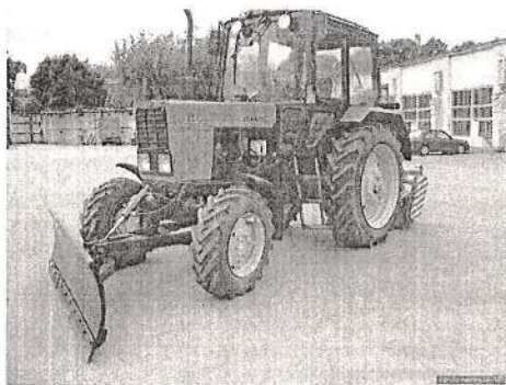
Рис. 4.1. Снегоуборочная машина МТЗ-82 с отвалом для снега

Для выполнения зимних уборочных работ используются снегоуборочные машины, в частности с плужно-щеточным оборудованием. К примеру, может использоваться навесное оборудование для тракторов МТЗ: отвал типа УМДУ 80/82, щетка дорожная ПЩ-1.8, снегоборщик СУ 2.1 и др. Могут быть использованы также специализированные машины типов КО-713, КО-707 (на базе трактора МТЗ), КО-718, МКСМ-800 и другие. Наилучшими характеристиками из них обладает КО-713 (рис. 4.1): ширина полосы, очищаемой плугом 2,5-3 м, ширина полосы, очищаемой щеткой 2,3 м, максимальная скорость 20 км/ч. Цена КО-713 около 1,7 млн. руб. Дальнейшие расчеты произведем для машины этого типа.